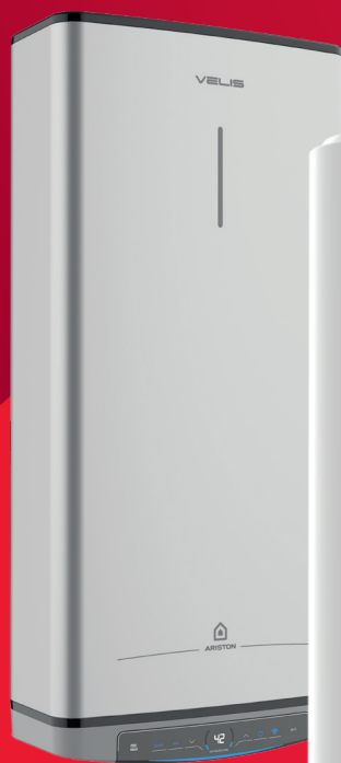
Velis Dune Dry Wifi FE

Contribuez à la Transition Energétique grâce à nos chauffe-eau électriques intégrant le service Flexibilité Energétique !