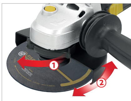
Carter indexable sans outils Keyless swivelled carter