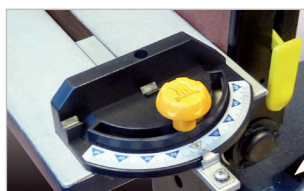
Guide d'angle Angle guide