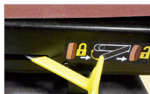
Changement rapide de bande Quick release belt lock