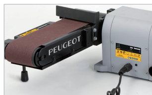
Bras inclinable Tilting handle