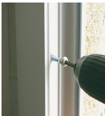
La VIS-TOP peut être ressortie