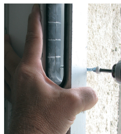
Grâce à la main libre on peut tenir un niveau pour vérifier l'aplomb. Ex. : porte-fenêtre, évite le cintrage