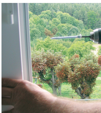
Grâce à sa tête hexagonale, on libère une main (la vis tient seule)