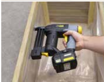
Prise en main ergonomique Ergonomic handle