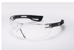
Monture souple et légère