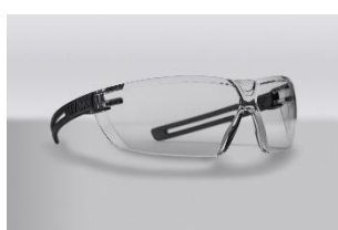
Design en croix