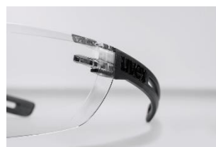
Concept innovant des branches