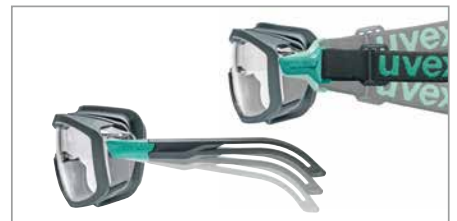
3 niveaux d'inclinaison des branches et du bandeau pour un ajustement individuel