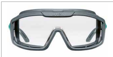
Oculaire au design plat pour un champ de vision dégagé

La gamme uvex i-range planet est flexible et contribue efficacement à la protection de l'environnement, conformément à notre devise protecting planet .