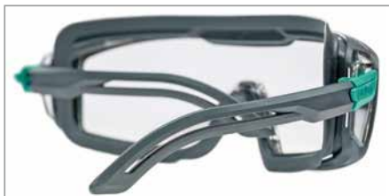
Branches ergonomiques pour un ajustement parfait et un maintien stable sans points de pression