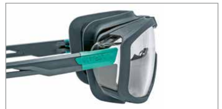
x-tended sideshield pour une protection de la région oculaire latérale