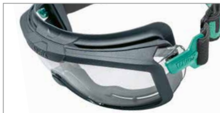
Pont de nez souple et flexible en matériaux durables pour un ajustement universel