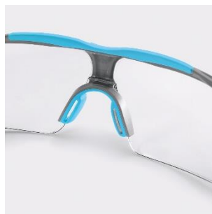
Pont de nez souple