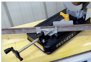
Étau réglable 45° Vise setting 45°