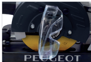
Support pour lunettes Glasses holder