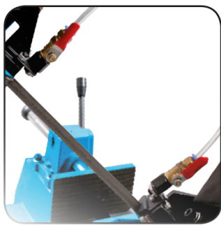
Arrosage et guide-lame. Afstelbare zaagaanslag en zaagbladgeleiding.