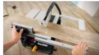
Extension de table rétractable Retractable table extension