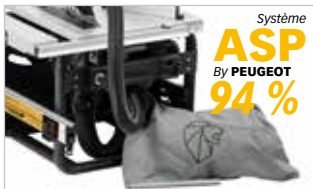
Sac collecteur de poussières intégré (14L) Integrated dust suction (14L)