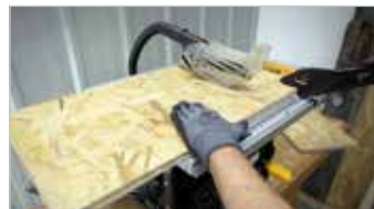
Carter de lame transparent Transparent blade guard