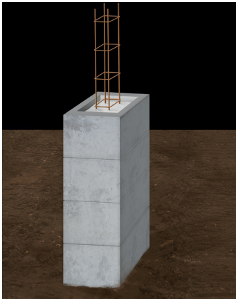
Remplissage de pilier Pillar filling