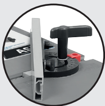
Guide d'angle Angle guide