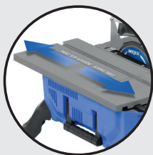
• Table sur glissière Sliding table