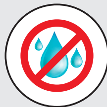
Coupe sans eau Waterless cutting