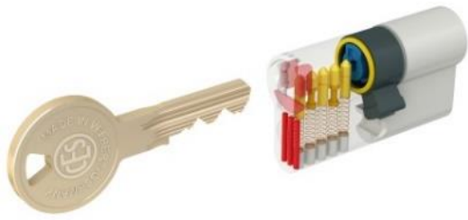
Cylindre PSM5 A2P1* brevet 2030, 4 clés