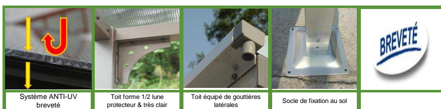
Système ANTI-UV breveté