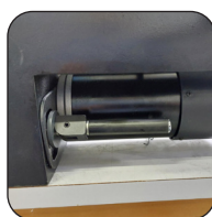
Moteur TEFC à charbons pour un rendement optimal