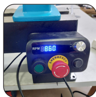
Boîtier de commandes magnétique