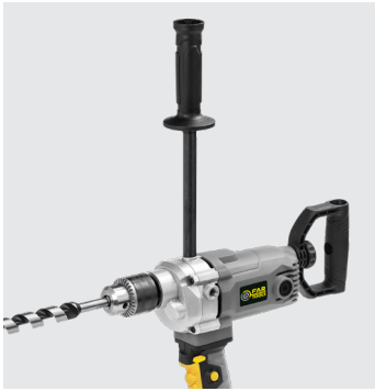
Poignée 3 positions 3 positions handle