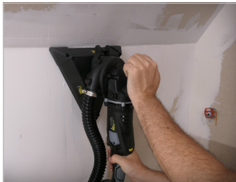
Ponçage en bordure Edging sanding