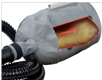
Aspiration autonome Independent fan