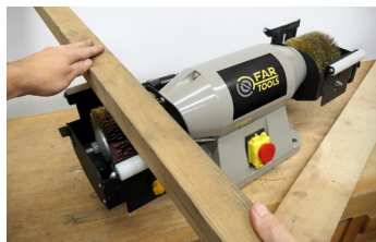
Travail précis en appui Stationnary work for more accuracy