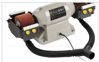
Tubes et connexion en Y Tubes and Y-connection