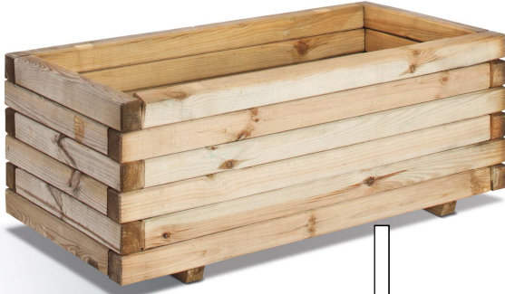
2 lambourdes - beams: lg 4 x H 3 cm épaisseur fond - bottom thickness 2.5 cm