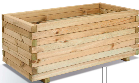
2 lambourdes - beams: lg 4 x H 3 cm épaisseur fond - bottom thickness 2,5 cm