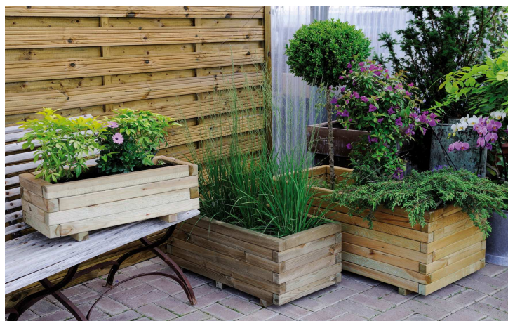
butt-jointed bottom planks and fitted into the bottom wall