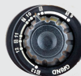
Teinte 5>13 et mode meulage