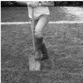
Fini le travail difficile à la pelle bêche Easier than with shovel

La trancheuse de sol électrique remplace avantageusement la pioche et la pelle pour réaliser des tranchées rectilignes et sans efforts sur de grandes distances.