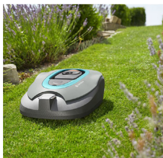
Idéal fil périphérique pour robot tondeuse Ideal peripheral wire for robot mower