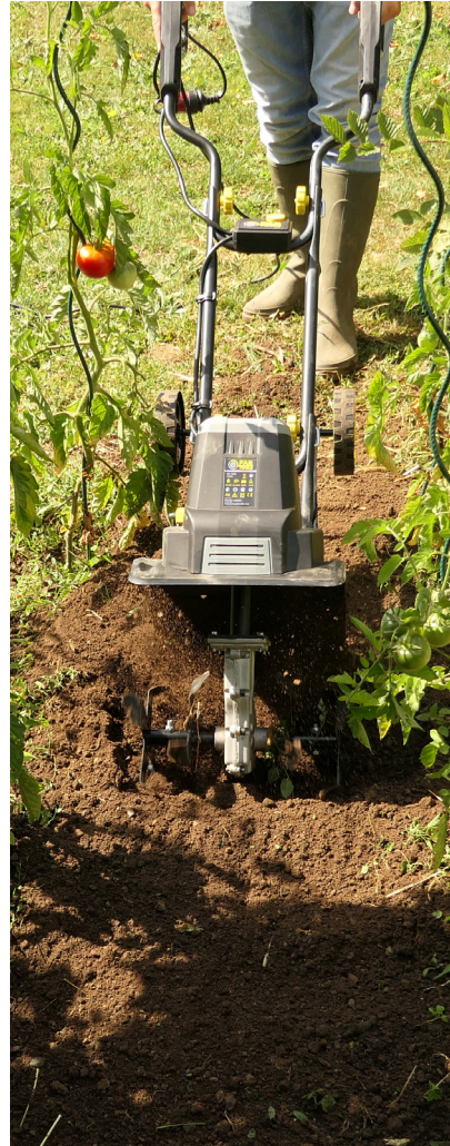
Motobineuse : Travail du jardin Tiller: Garden work