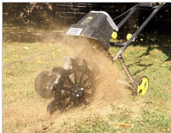
Trancheuse : Enfouissement Trencher: landfill