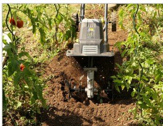
Motobineuse : Travail du jardin Tiller: Garden work