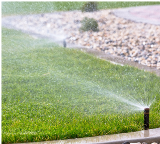
Irrigation AUTOMATIQUE AUTOMATIC Irrigation