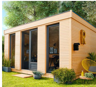
Branchement abri de jardin Garden shed connection