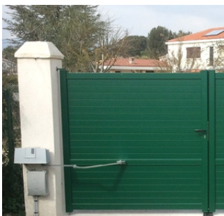
Alimentation portail ou vidéophone Gate or videophone power supply