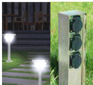
Sources lumineuse et électrique Light and electrical sources