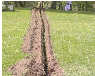
Parfait pour de longues distances Perfect for long distances

The electric soil trencher advantageously replaces pickaxe and shovel to make trenches straight and effortless over great distances.