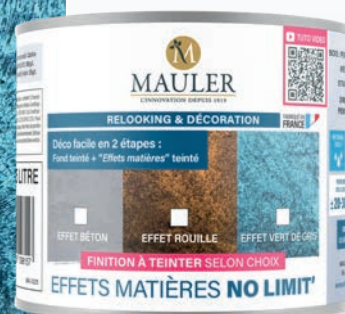
EFFET VERT DE GRIS