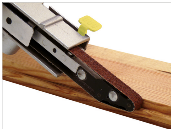
Bras avec méplat Flat arm