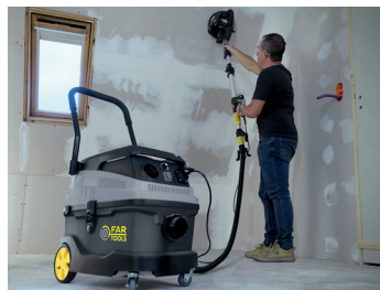
Fonction PLÂTRE PLASTER function