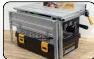
Stockage des extensions de table 580x400x410 mm (Lxlxh) Table extensions storage