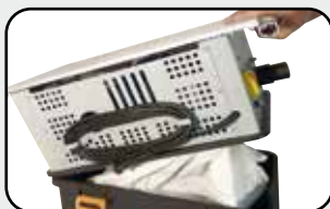
Aspirateur intégré Built in vacuum cleaner