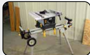
S'adapte sur support de scie Fit on miter saw stand