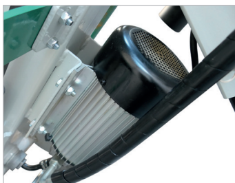
Moteur aluminium Aluminium motor