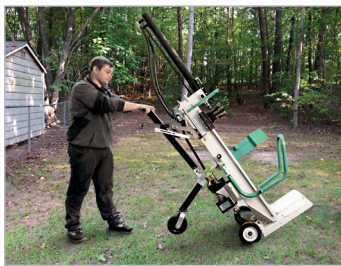
Transport facilité Easy to transport