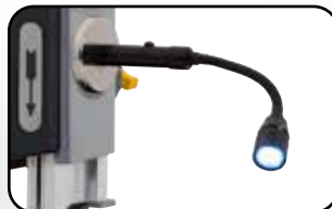
Eclairage par LED magnétique orientable Adjustable magnetic LED light