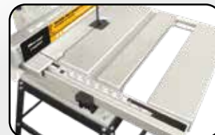
Extension à serrage rapide Table extension with quick tightening