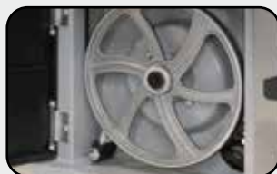
Volants en fonte d'aluminium (200 mm) Wheels in cast aluminium (200 mm)