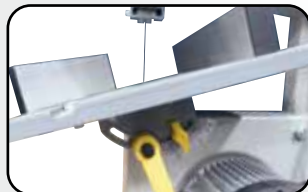
Table en fonte d'aluminium inclinable à 45° Cast aluminium table 45° tiltable