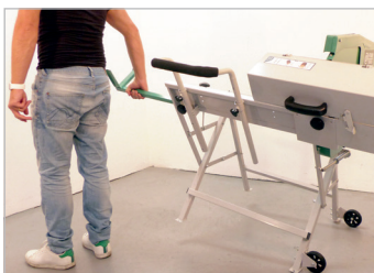
Poignée de transport Transportation handle