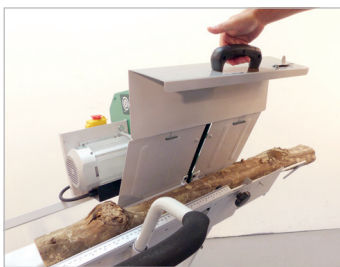
Carter de protection Safety cover