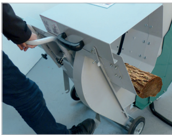
Carter de protection Safety cover