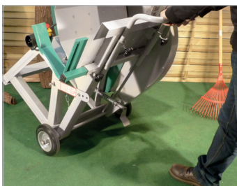
Poignée de transport Transportation handle