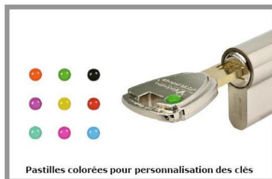
Pastilles colorées pour personnalisation des clés

* Sous réserve d'utilisation avec l'ensemble des accessoires serrures et gâches homologuées.