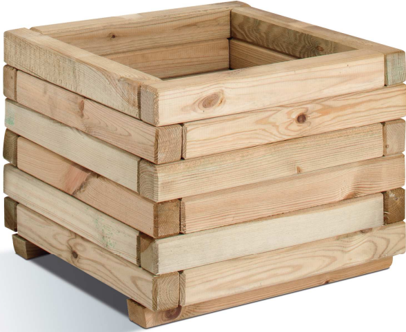
2 lambourdes - beams: L 39 x lg 4 x H 3 cm épaisseur fond - bottom thickness 2.5 cm