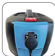
Prise synchronisée pour appareil électroportatif