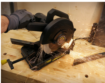
Coupe d'angle Angle cut

Livrée avec 1 disque abrasif monté Delivered with 1 mounted abrasive disc