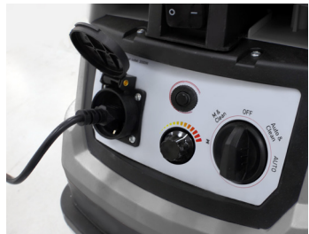
Prise asservie Synchronized socket

Livré avec 1 sac en tissu, filtre cartouche et 1 suceur long. Supplied with 1 fabric bag, cartridge filter and 1 long nozzle.