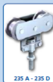
235 A - 235 D