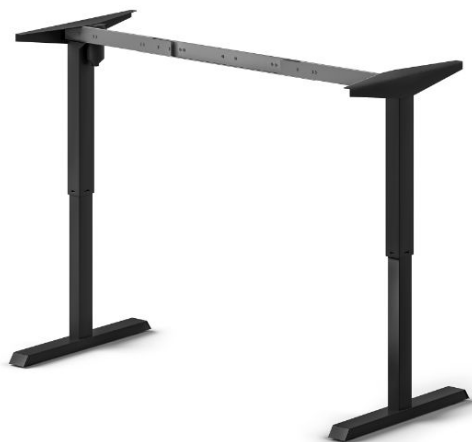
Table motorisée à hauteur réglable, Peint en noir, Acier