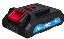
Batterie 20V Li-Ion 2.0 Ah