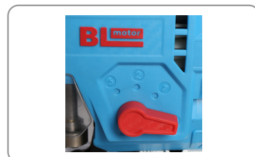
Mouvement pendulaire à 4 positions.