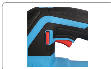
Gâchette de démarrage avec bouton de déverrouillage.