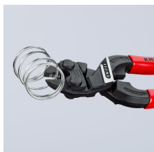
Puissant jusqu'aux pointes