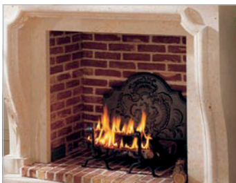
Spécial cheminée, insert Special fire place