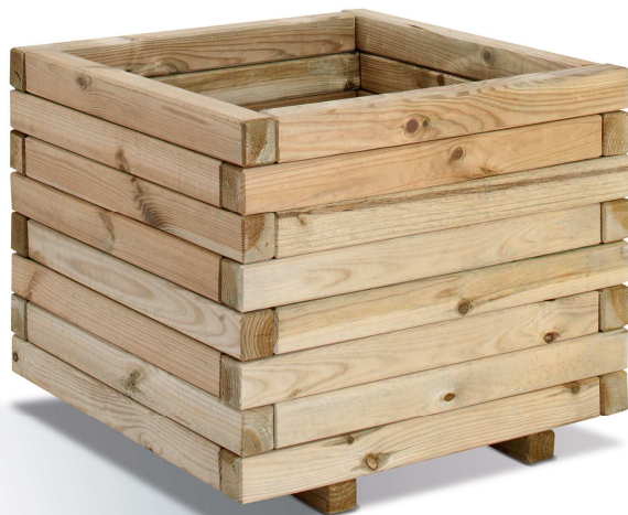
2 lambourdes - beams: lg 4 x H 3 cm épaisseur fond - bottom thickness 2.5 cm